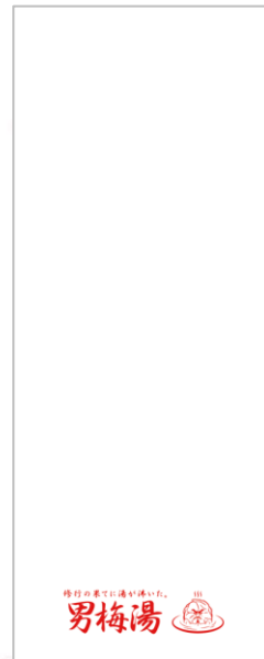
浴用タオル 価格：各¥200（税込）