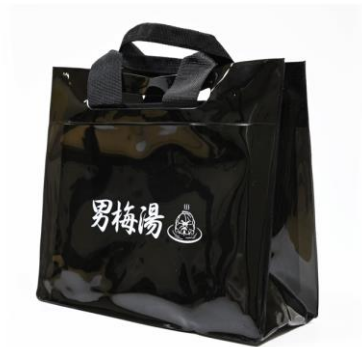
スパバッグ 価格：¥1,500（税込）