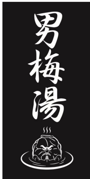
バスタオル 価格：¥2,000（税込）