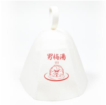
サウナハット 価格：¥3,000（税込）

男梅みくじの1等～3等の景品としてお渡しする「男梅×大黒湯オリジナルグッズ」は大黒湯物販にて数量限定で販売いたします。また、大黒湯オンラインショップでの販売も予定しております。