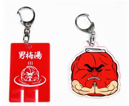
キーホルダー（全2種） 価格：各¥400（税込）